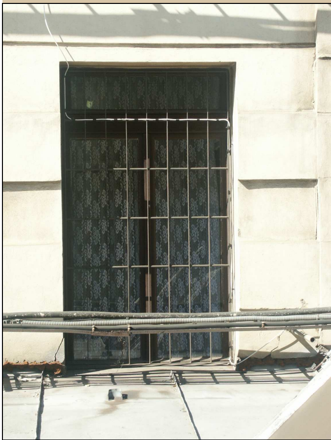
celkový pohled z exteriéru