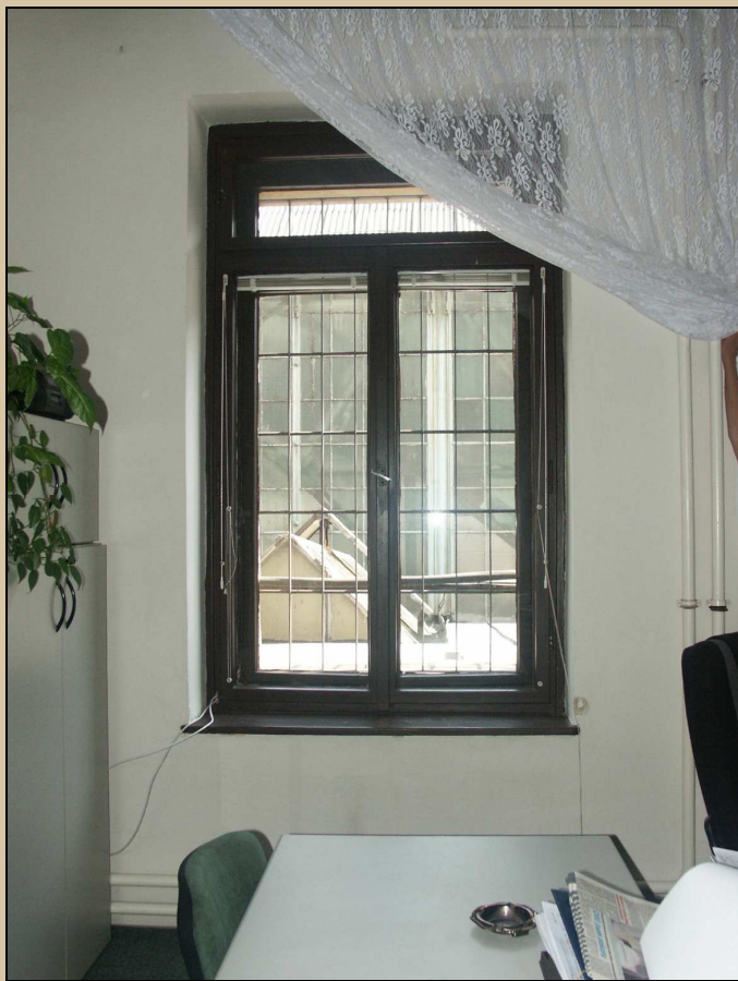
celkový pohled z interiéru